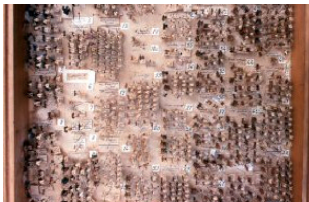
Fourmis de la collection A. Forel, env. 1870

Une bonne occasion de voir des milliers d'insectes qui ne sont pas présentés au public et de découvrir certaines facettes méconnues du travail dans les collections entomologiques !