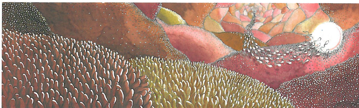
Illustration d'Amélie Frison pour Zooïne sur les sentiers de la vie .

Des animations de lecture du conte par le comédien Vincent Aubert sont prévues en semaine pour les classes et les 1ers samedis du mois gratuit pour le public.