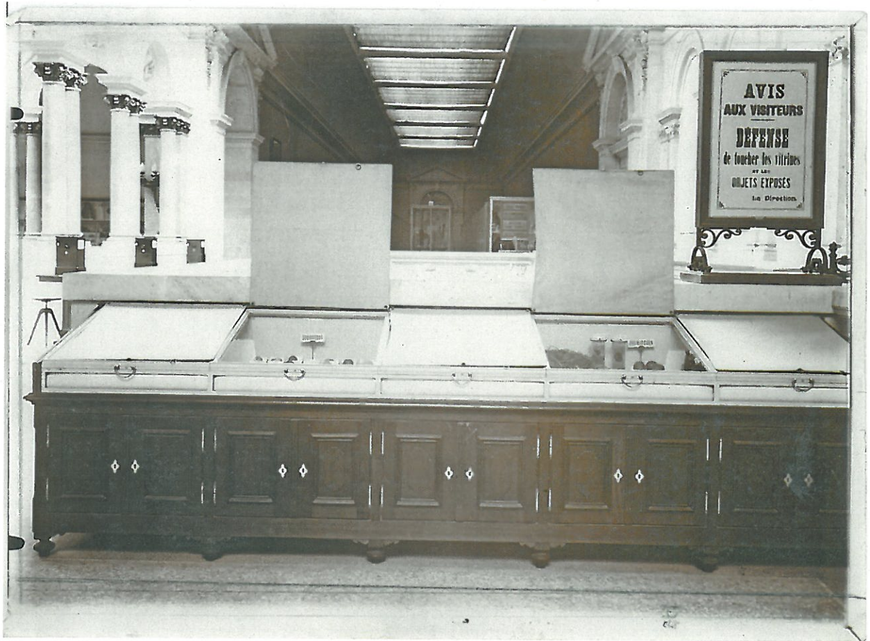
REFLETS d'autrefois, quand le musée était un peu semblable et un peu différent (env. 1910) DR