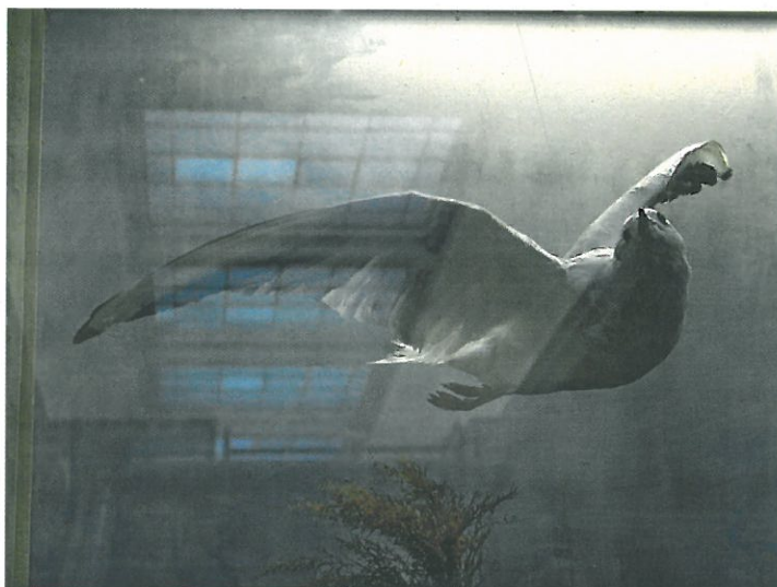
REFLETS dans les vitrines du musée (MK/MZL)...