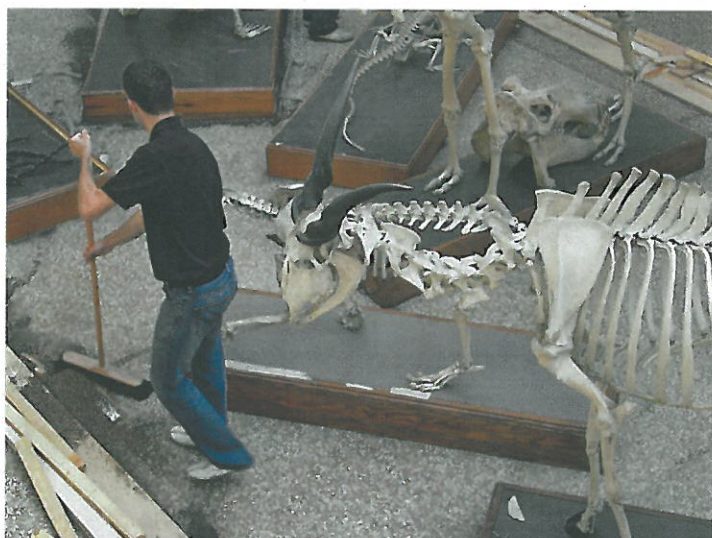
... ou REFLETS de la vie au musée ! (MK/MZL)